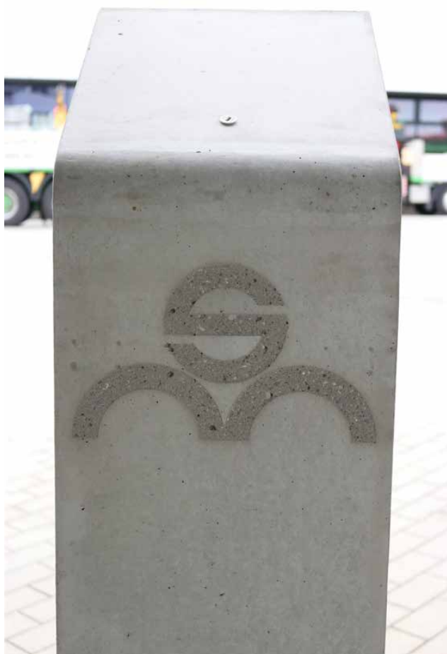
Exemple avec un logo sablé