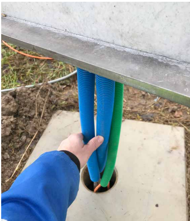
Introduction des tubes de protection des câbles