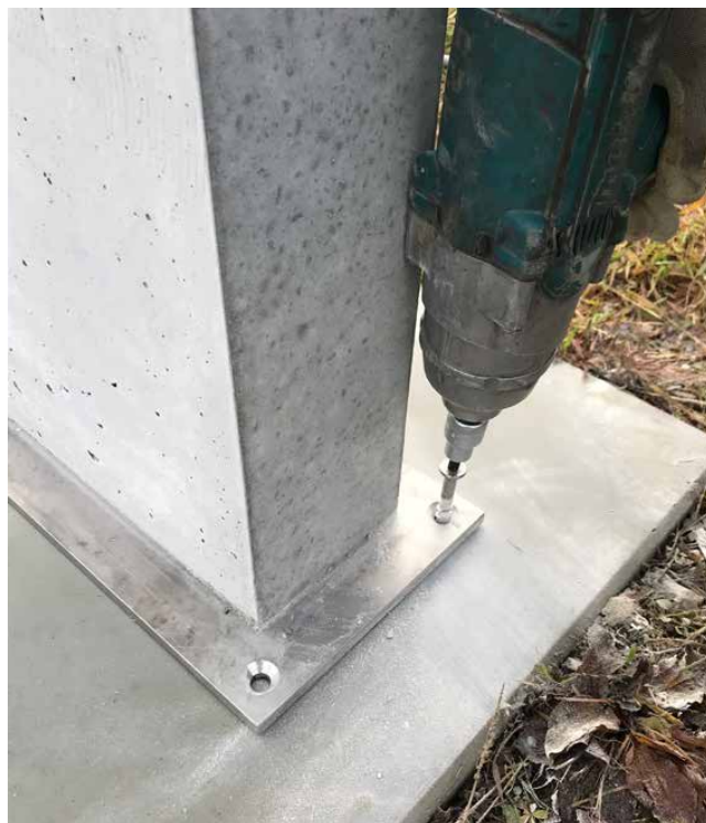
Fixation de l'élément en béton