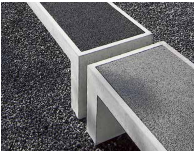
Sitzeinlagen aus wasserdurchlässigem Kunststoff