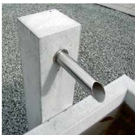
Brunnenstock Junior mit eckigem oder rundem Auslauf