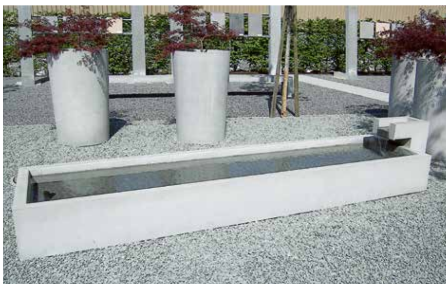
L 90, B 90, H 37 cm (Inhalt 130 l), L 200 (Inhalt 325 l), L 360 cm (Inhalt 620 l)

INTERMEZZO® Elemente sind zeitlos faszinierend, edel und wertbeständig. Wasserbecken können auch in individuellen Grössen, ganz Ihrer speziellen Situation angepasst, hergestellt werden.