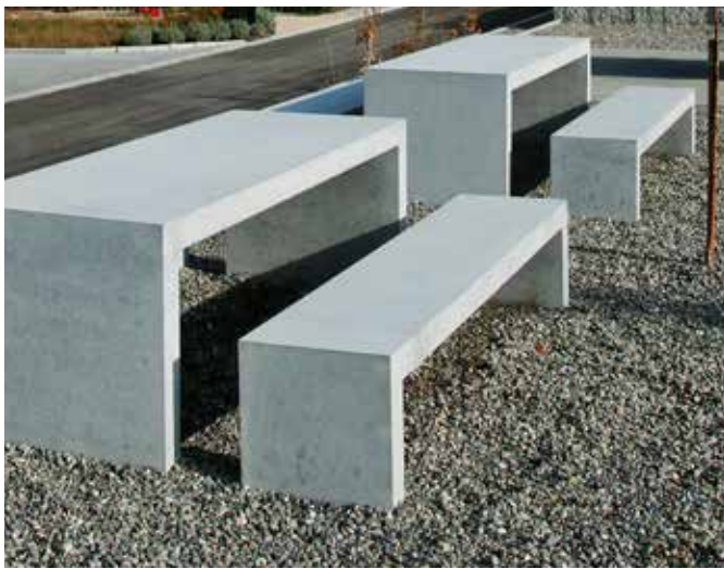
INTERMEZZO® Tisch und Bank

Diese funktionellen Kunstwerke sind aus einem Guss gefertigt. Mit der schlichten Ästhetik werden sie von Umgebungsdesignern, Planern und Architekten sehr geschätzt, und bevorzugt im öffentlichen Raum eingesetzt. Farbtupfer zum schlichten Grau des Betons bilden die farbigen, wasserdurchlässigen Sitzeinlagen aus unverwüstlichem Kunststoff.