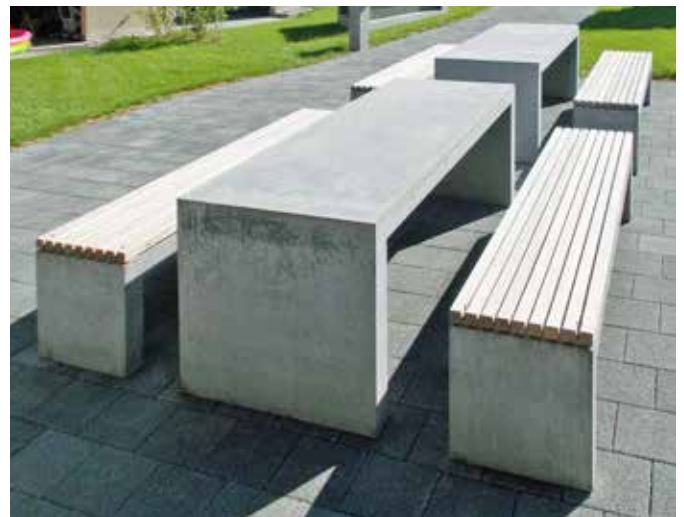
Holzrost aufliegend ohne Lehne