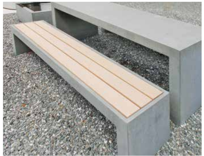
Bank mit Vertiefung und Holzsteinlage aus Sipo-Holz