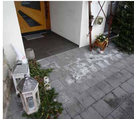
Kalkausblühungen auf jungen Betonpflastersteinen im Eingangsbereich.

Die Entstehung von Kalkausblühungen ist ein natürlicher, chemischer Prozess im Beton. Sobald Zement mit Wasser reagiert, wird Calciumhydroxid freigesetzt. Dieses ist in Wasser löslich und liegt im Porenwasser des erhärteten Betons vor. Wenn dieses im Porenwasser gelöste Calciumhydroxid mit dem Kohlendioxid aus der Umgebungsluft in Kontakt kommt, bildet sich Calciumcarbonat. Da Calciumcarbonat wasserunlöslich ist, kristallisiert es direkt an der Betonoberfläche als weisses Mineral aus – dies sind die sichtbaren Ausblühungen. Das dabei freigesetzte Wasser kann neues Calciumhydroxid aus dem Beton lösen, wodurch sich der Prozess wiederholen kann.