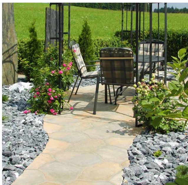
HACIENDA® CAMINOS polygonales Plattensystem