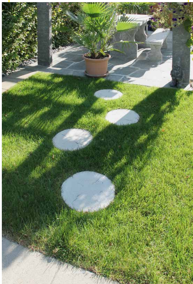
LENIA Schrittplatten rund

Ø 40 – 42 cm, Höhe 41 cm Gewicht 130 kg/Stk. (auf Bestellung mit Hohleinlage, ca. 80 kg/Stk.)